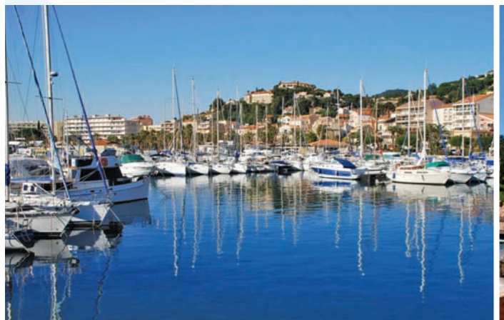
Le port du Lavandou

BORMES LES MIMOSAS - LA FAVIÈRE - LE LAVANDOU - CAP BÈNAT