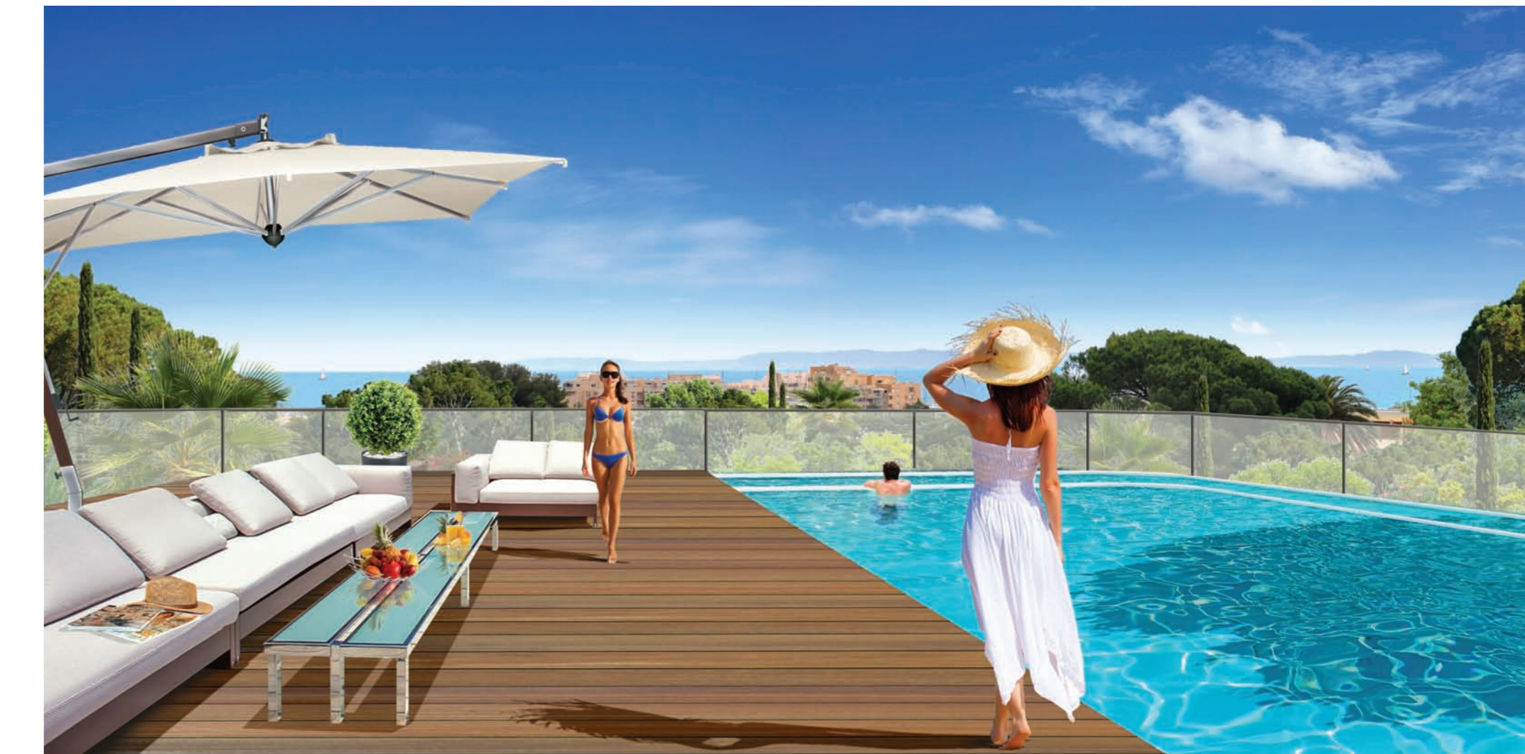
Vue panoramique depuis la piscine