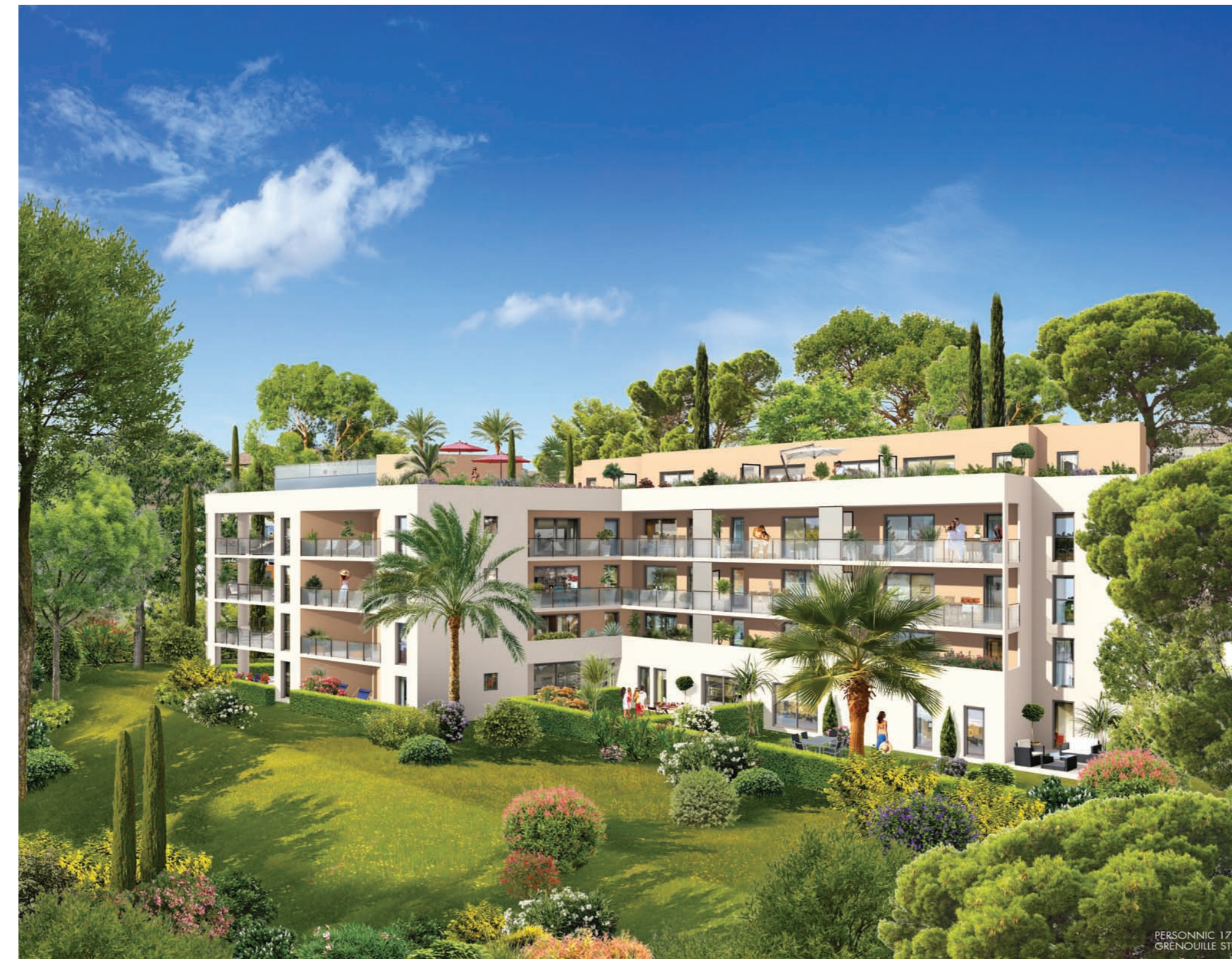
PERSONNICK 17 / GRENOUILLE STUDIO