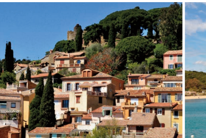
Bormes les Mimosas