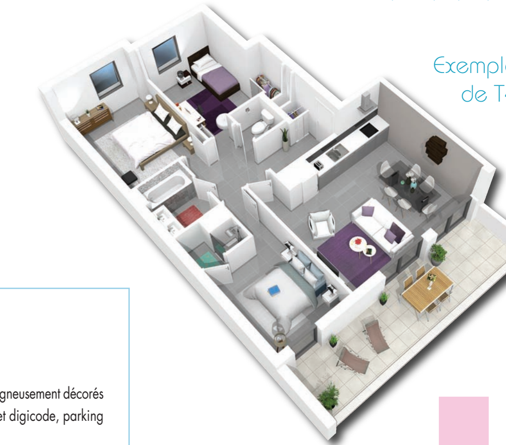
Exemple de T4

Les appartements ont de très belles terrasses ou des jardins privatifs . Très bien orientés, ils profitent d'une luminosité maximale et, pour la plupart d'une vue sur la mer, ou les collines du var.