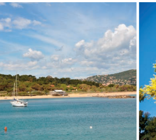
Plage à la Favière