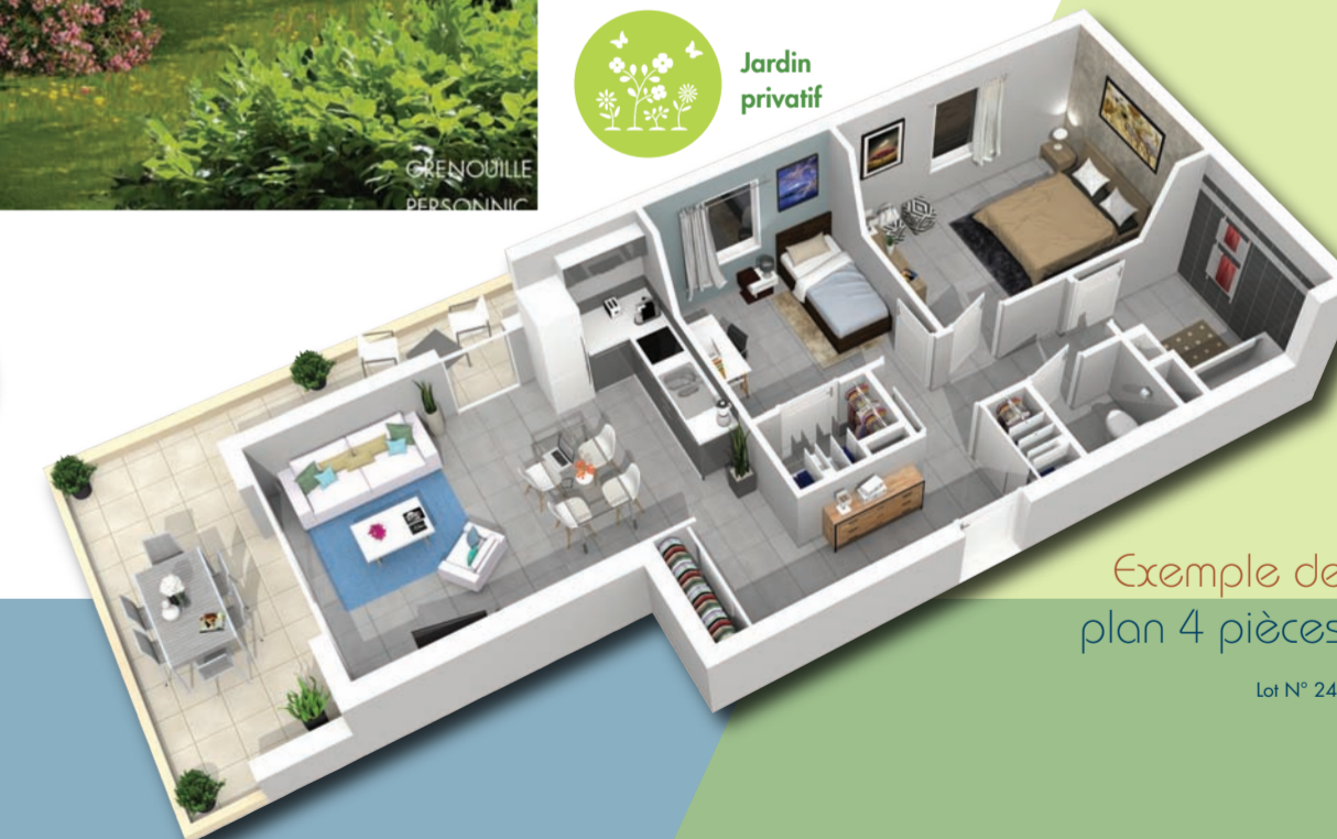
Exemple de plan 4 pièces